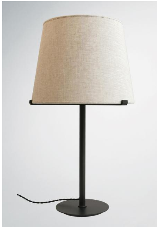
MALMÖ 1 o in geborsteld brons met een conische lampenkap in Lin Moscou (stof uit categorie 2)