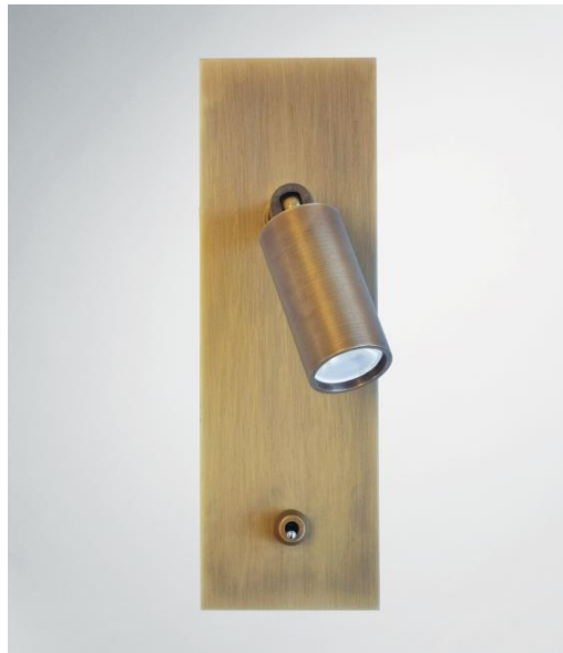
TINOS in lichtbrons. Metaal afwerking code: 28