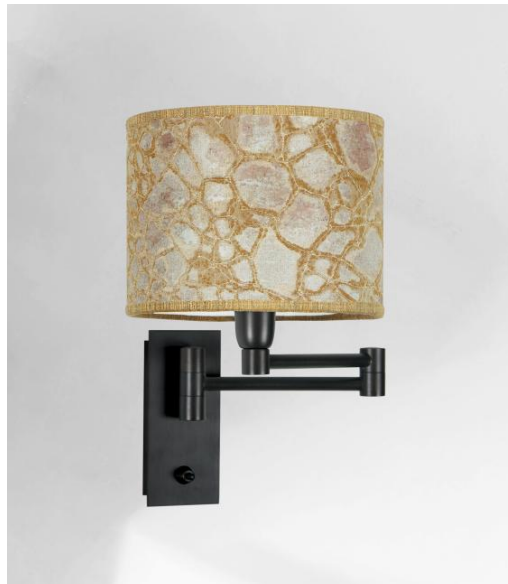
AHMOSIS +SW in geborsteld brons met lampenkap in Tilia Amadou (stof uit categorie 5)