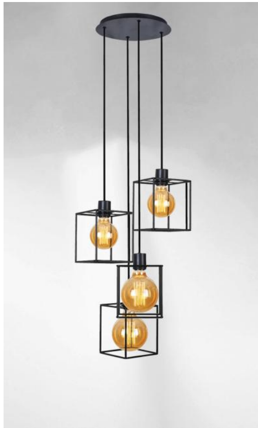
KERMA 4 o26 in geborsteld brons met structuren in zwarte epoxy afwerking