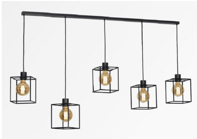
KERMA L 5 in geborsteld brons met structuren in zwarte epoxy afwerking