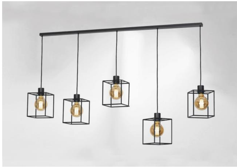
KERMA L 5 in geborsteld brons met structuren in zwarte epoxy afwerking