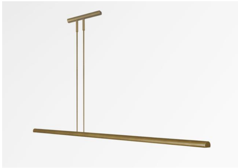
AXELL 120 in lichtbrons