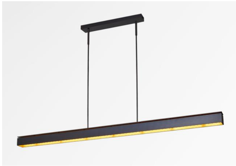
GALAND J tubes in geborsteld brons. Metaal afwerking code: 29