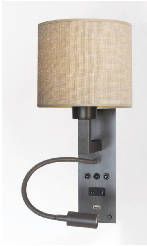
Wandlamp op maat voor hoofdeinde van het bed in geborsteld brons met cilindervormige lampenkap in Stone Calcite (stof uit categorie 4)