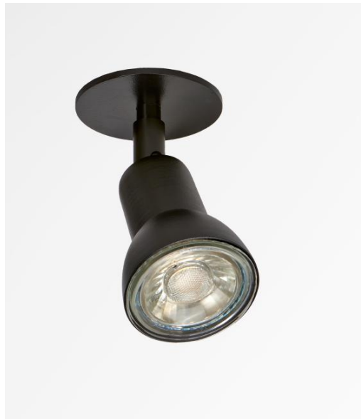
SALENTO 6 in geborsteld brons