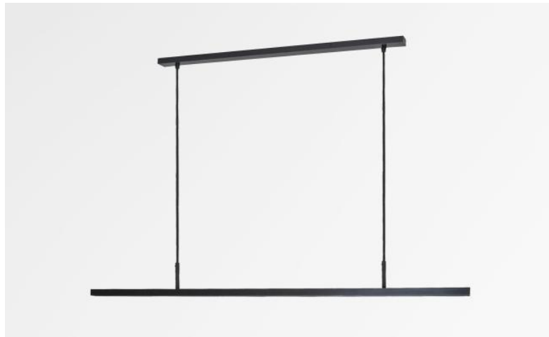
POLARIUS 120 in geborsteld brons