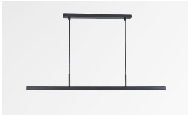
POLARIUS 90 in geborsteld brons