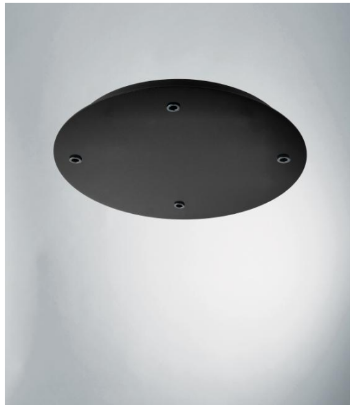
CEILING BASE 4 o26 in gestructureerd zwart. Metaal afwerking code: 02. Opties: een grote keuze aan kabels en fittingen (+supplement)