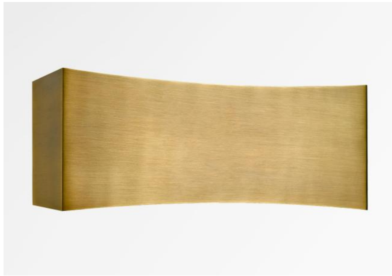
PHOBOS in lichtbrons. Metaal afwerking code: 28