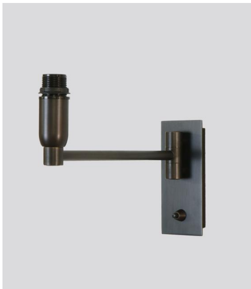
SOKARIS +SW in geborsteld brons zonder lampenkap