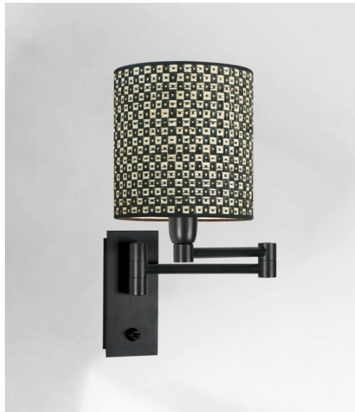
AHMOSIS +SW in geborsteld brons met lampenkap in Polka (materiaal uit categorie 5)