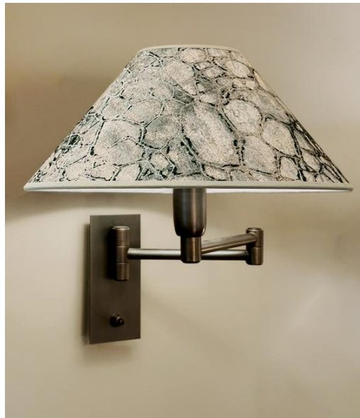
AHMOSIS +SW geborsteld brons met lampenkap Tilia Gravière (cat.5)