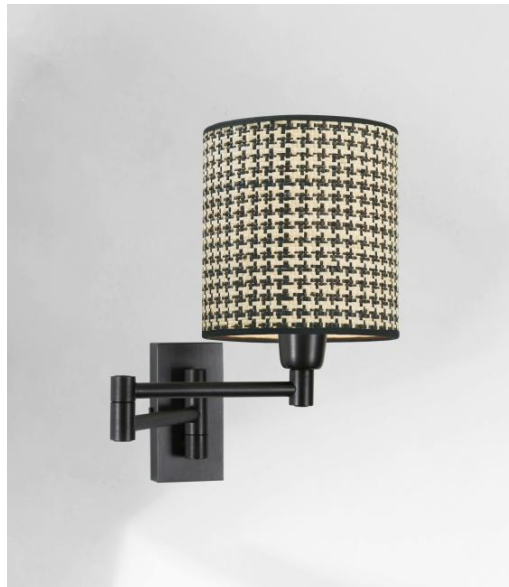
MAMMISI -SW in geborsteld brons met lampenkap in Palmier Pied de Poule (materiaal uit categorie 5)