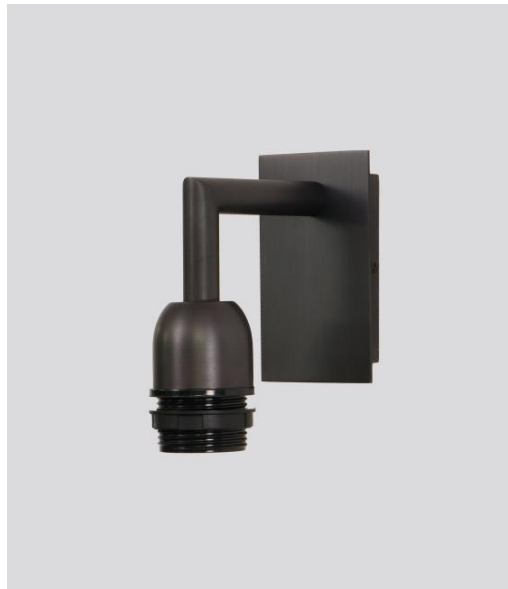
EDFOU 1 in geborsteld brons zonder lampenkap