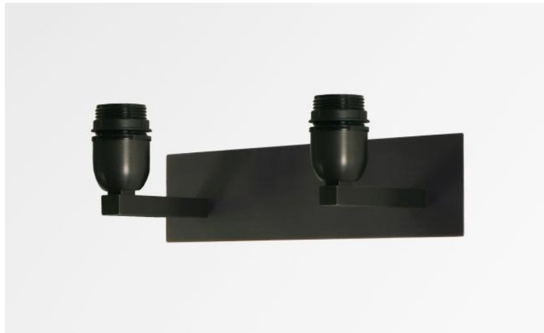
MONTOU in geborsteld brons zonder lampenkappen