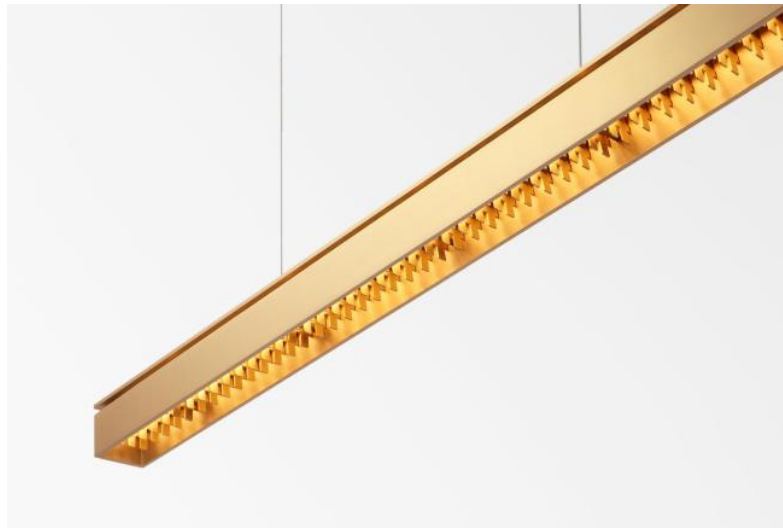
GALAND J ø in gesatineerd messing. Metaal afwerking code: 25