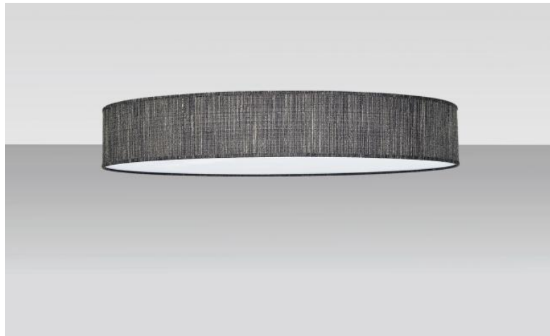
Lampenkap KENTIKA 60 FINE in Turda quartz (stof uit categorie 3)