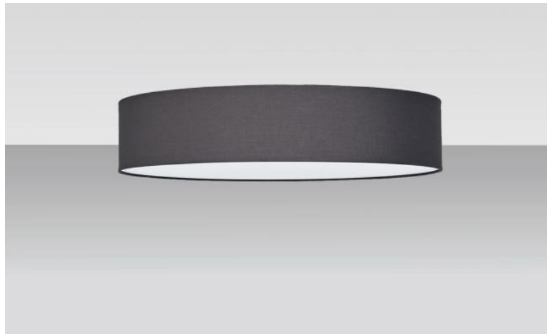
Lampenkap KENTIKA 50 FINE in Coton ardoise (stof uit categorie 1)