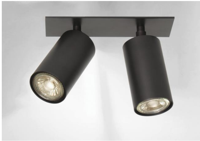
DEIMOS P2 # in geborsteld brons. Metaal afwerking code: 29