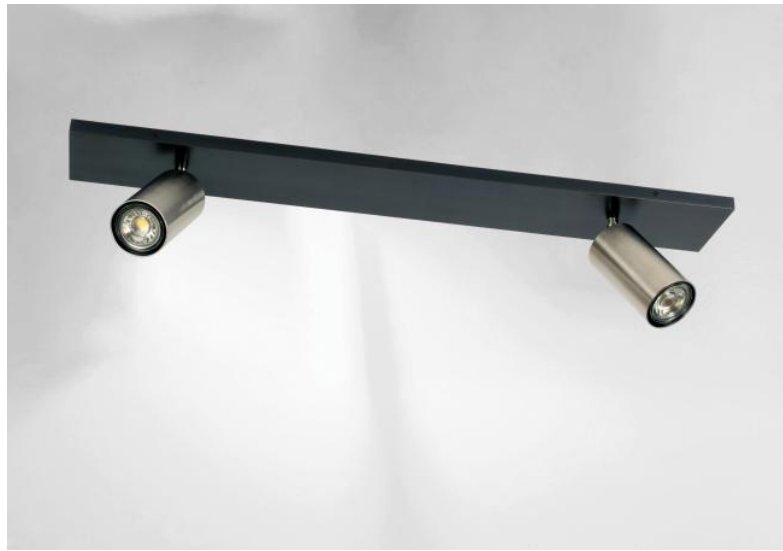
DEIMOS L2 in gestructureerd zwart en in gesatineerd nikkel. Metaal afwerkingen code: 43