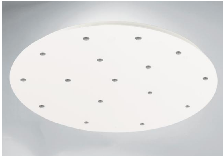
CEILING BASE 16 o83 in gestructureerd wit. Metaal afwerking code: 01. Opties: een grote keuze aan kabels en fittingen (+supplement)