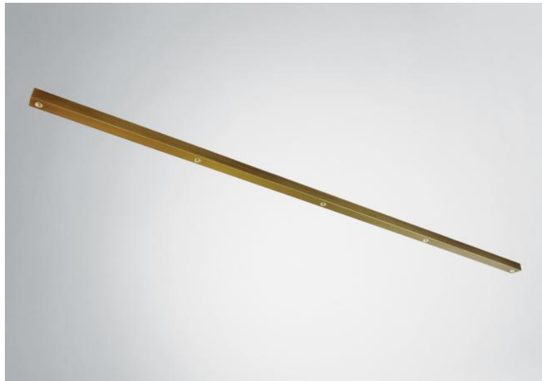
Ceiling base L 5