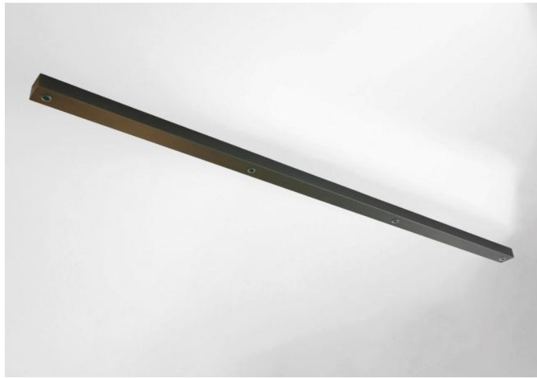
Ceiling base L 4