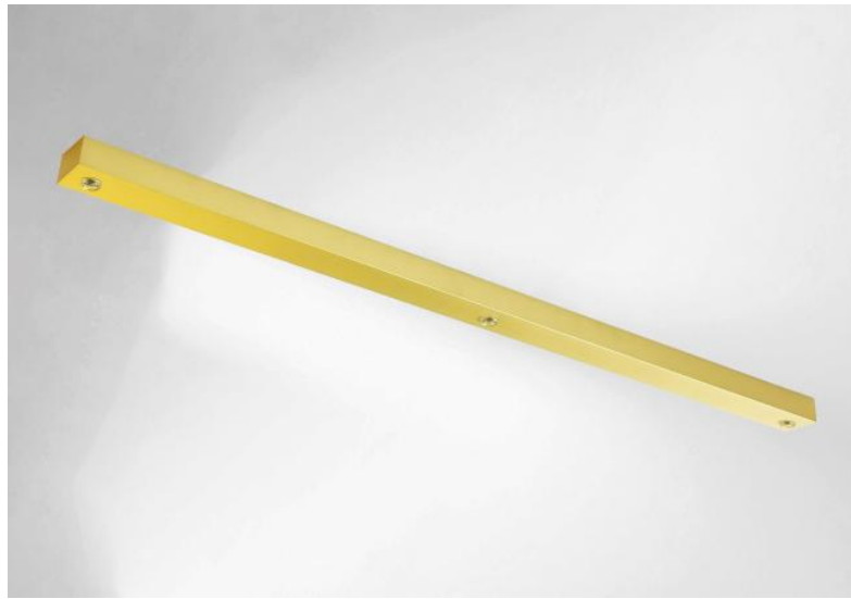
Ceiling base L 3