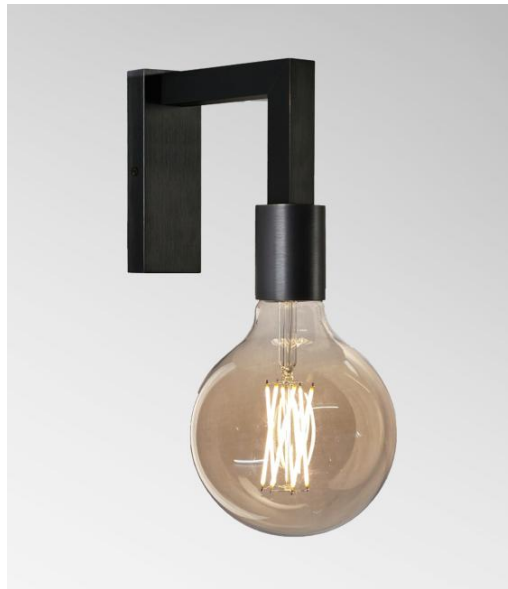
MESSENGER L in geborsteld brons met een decoratieve gouden gloeilamp Ø125mm