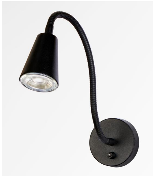
DESPINA in gestructureerd zwart. Metaal afwerking code: 02