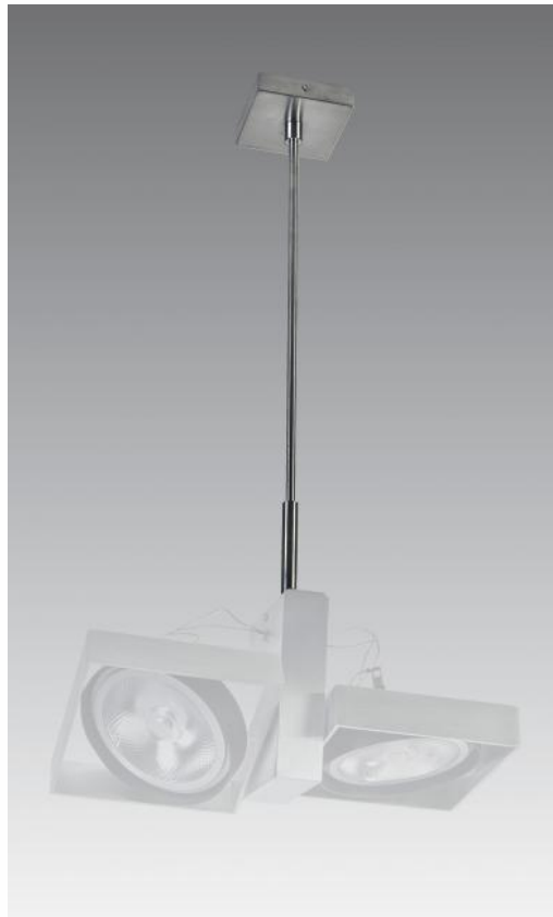
SARGAS 2 gemonteerd op een SARGAS 2 SUSPENSION