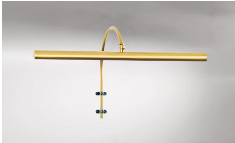
TRIANON 40 in gesatineerd messing. Metaal afwerking code: 25