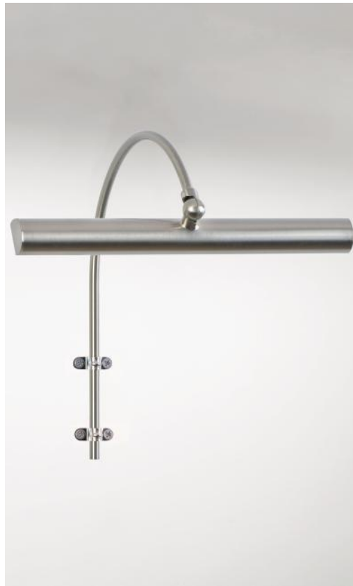
TRIANON 25 in gesatineerd nikkel. Metaal afwerking code: 33