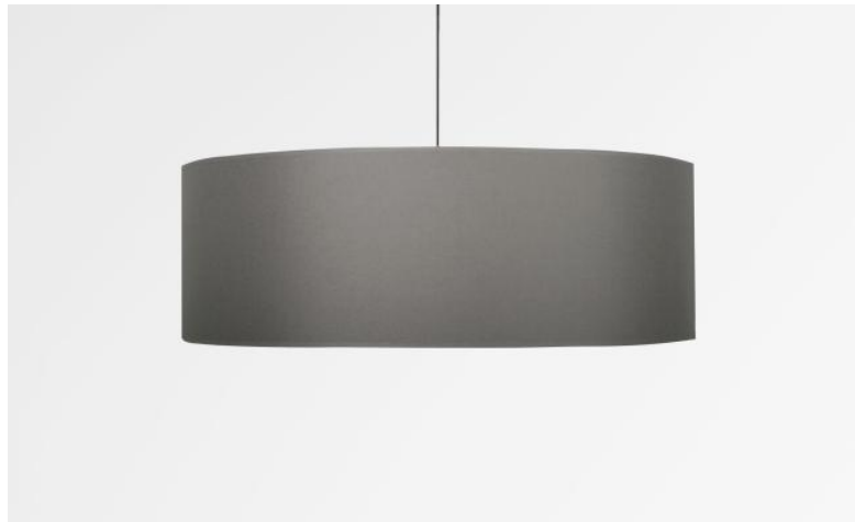
Lampenkap KENTIKA 50 SHORT in Seta plomb (stof uit categorie 3)