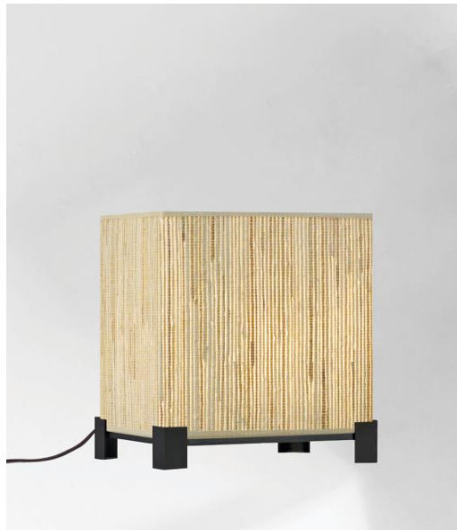
IMHOTEP 1 in geborsteld brons met lampenkap Jacinthe Naturelle (materiaal uit categorie 5)