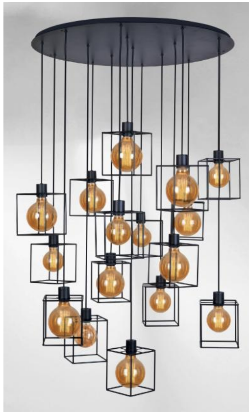
KERMA 16 o83 in gestructureerd zwart met structuren in zwarte epoxy afwerking