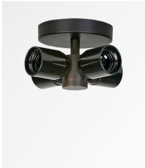
KENTIKA SHORT CEILING in geborsteld brons