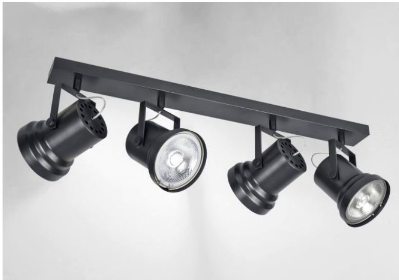
ATHENA 4 in geborsteld brons. Metaal afwerking code: 29