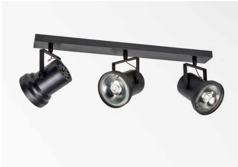
ATHENA 3 in geborsteld brons