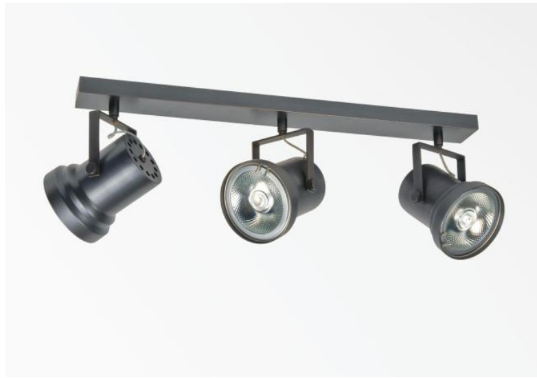
ATHENA 3 in geborsteld brons. Metaal afwerking code: 29