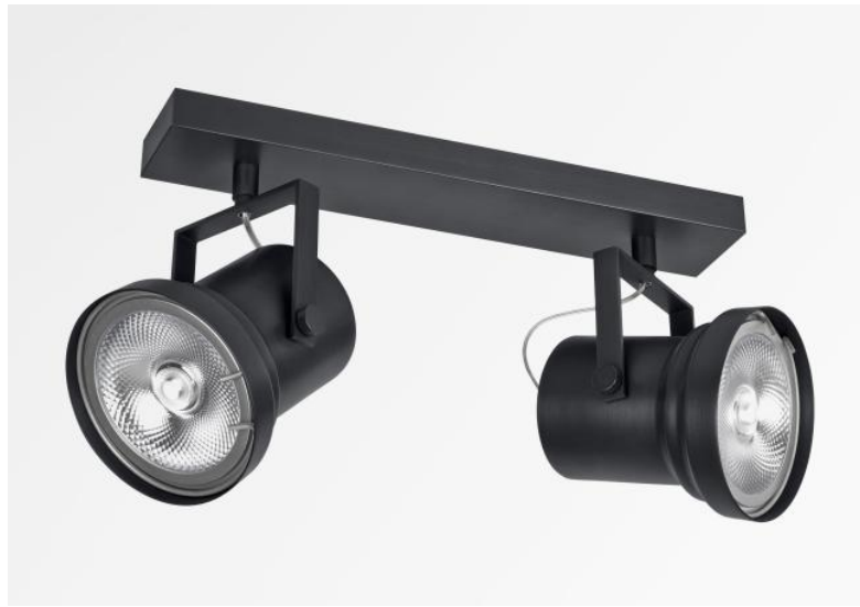
ATHENA 2 in geborsteld brons. Metaal afwerking code: 29