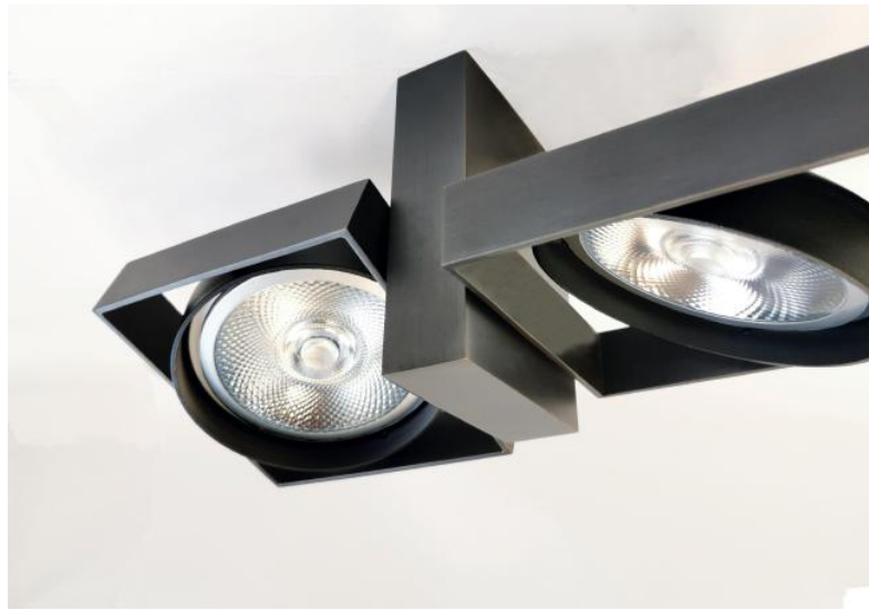
SARGAS 2 in geborsteld brons. Metaal afwerking code: 29