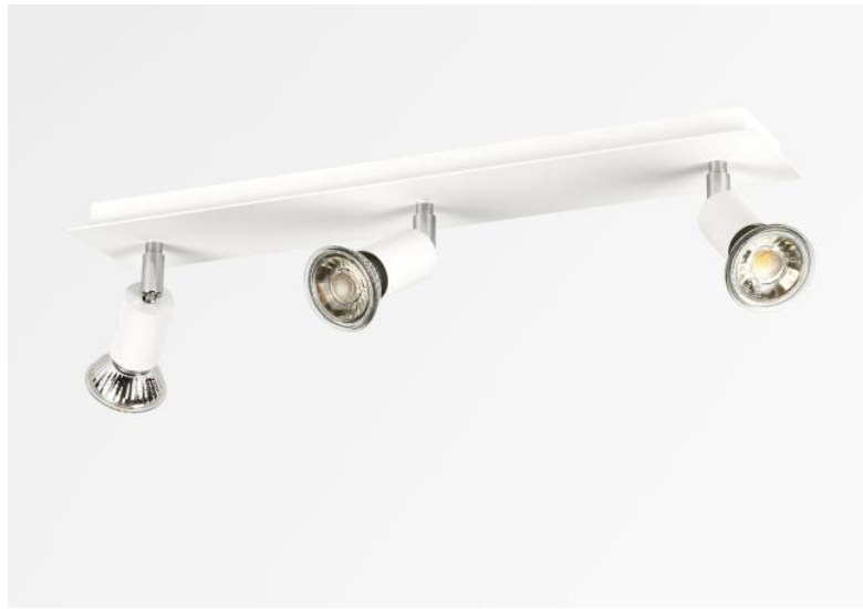
MERCURE 3 in gestructureerd wit