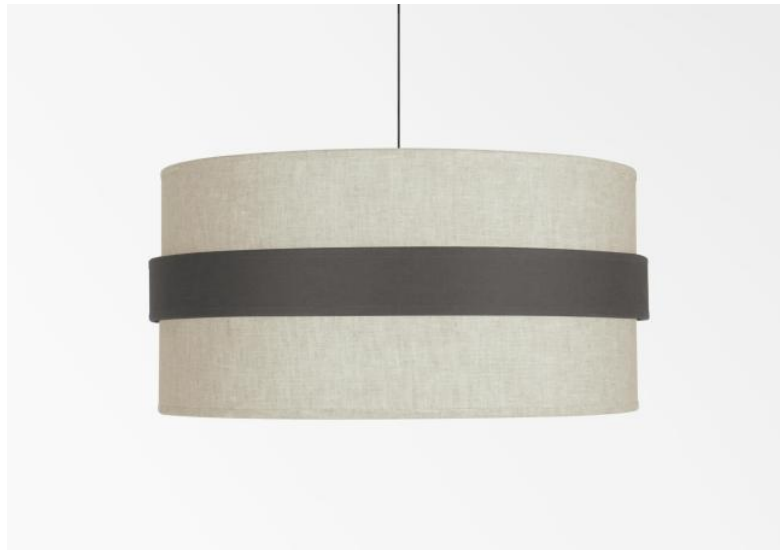
Lampenkap TOUYA 45 in Lin Moscou (stof uit categorie 2) met ring in Seta anthracite