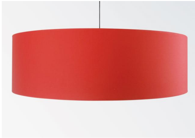
Lampenkap KENTIKA 100 in Coton rouge (stof uit categorie 1)