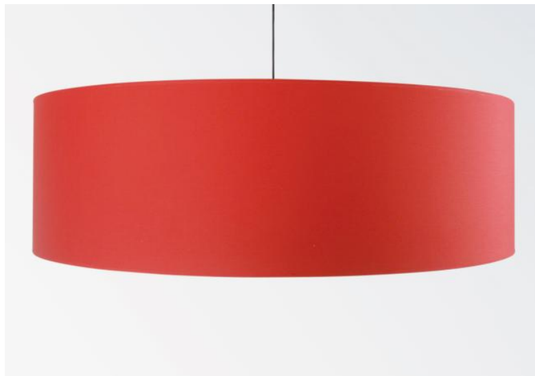
Lampenkap KENTIKA 100 in Coton rouge (stof uit categorie 1)