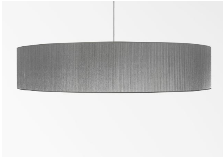
Lampenkap KENTIKA 100 SHORT in Plissé argent (stof uit categorie 4)