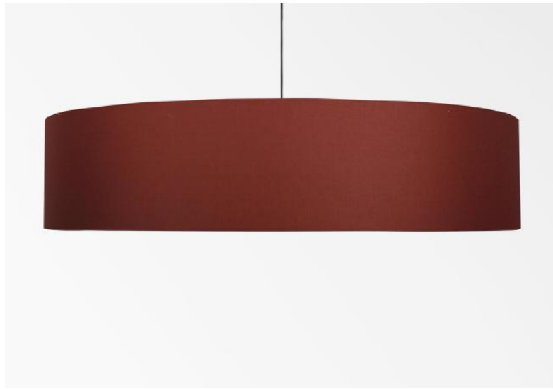
Lampenkap KENTIKA 90 SHORT in Seta pourpre (stof uit categorie 3)