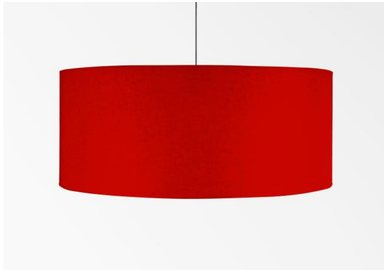
Lampenkap KENTIKA 80 in Coton rouge (stof uit categorie 1)