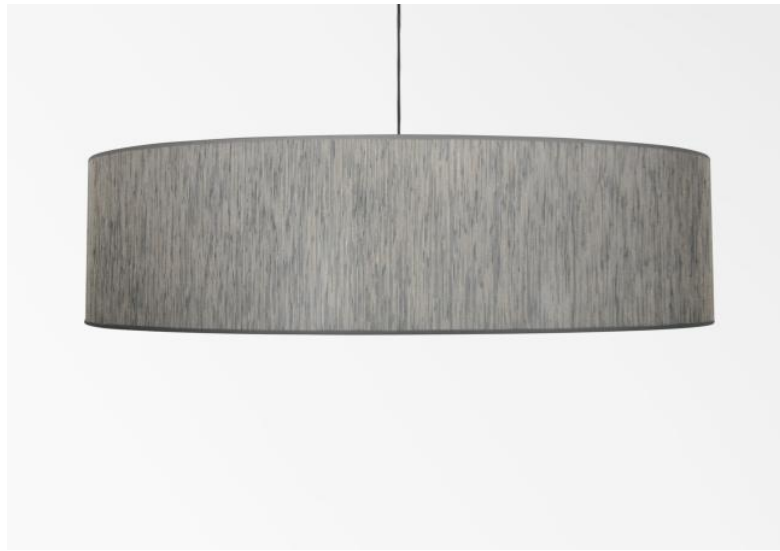
Lampenkap KENTIKA 80 SHORT in Vérone (stof uit categorie 3)