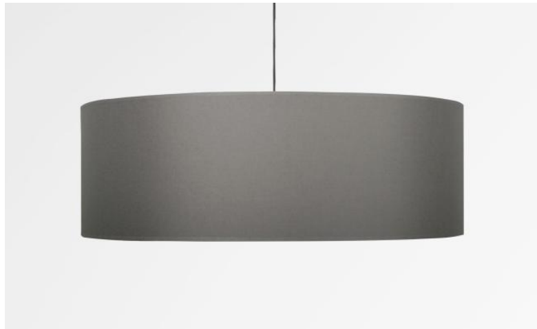
Lampenkap KENTIKA 60 SHORT in Seta plomb (stof uit categorie 3)