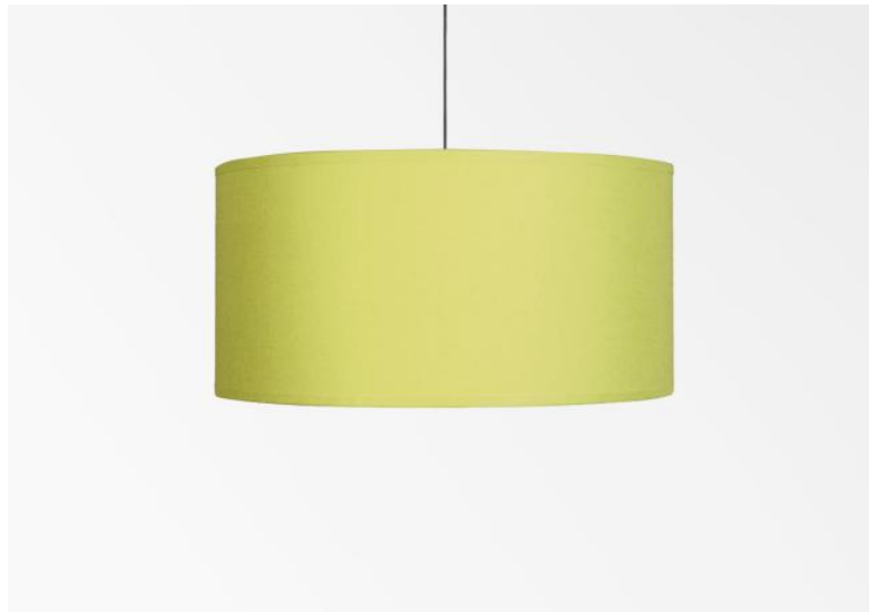
Lampenkap KENTIKA 50 in Seta lemon (stof uit categorie 3)